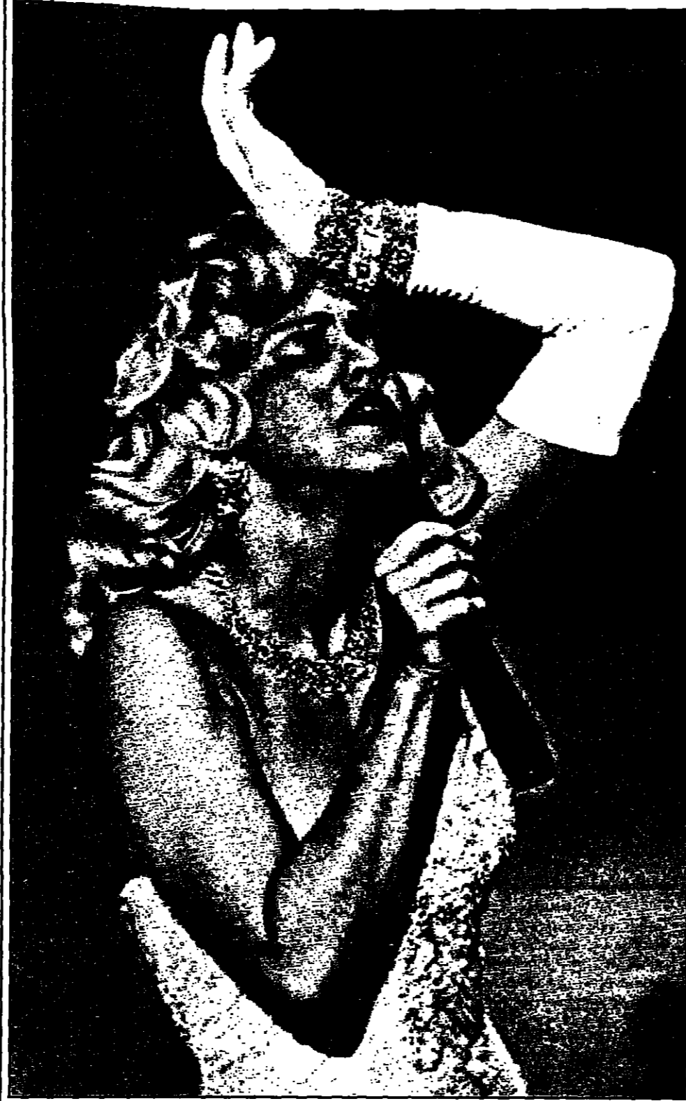
احتفلت نجمة الغناء الأمريكية مادونا بعيد ميلادها التاسع والثلاثين في حفل خاص أقامته في مقر إقامتها بلوس أنجلوس دعوت إليه عددا محددا من الأصدقاء.

تجولت في مدينة كوتاك في ولاية كيرلا جنوب الهند مجموعة من الأزواج المنفصلين الذين يطالبون بالحماية القانونية من زوجاتهم. وتطالب هؤلاء الأزواج من قبل السلطات الهندية بالحماية القانونية من زوجاتهم. وتطالب هؤلاء الأزواج من قبل السلطات الهندية بالحماية القانونية من زوجاتهم.